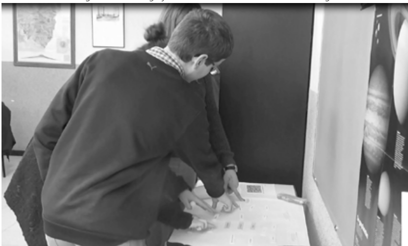
Leerlingen aan de slag tijdens het maken van een causaal diagram