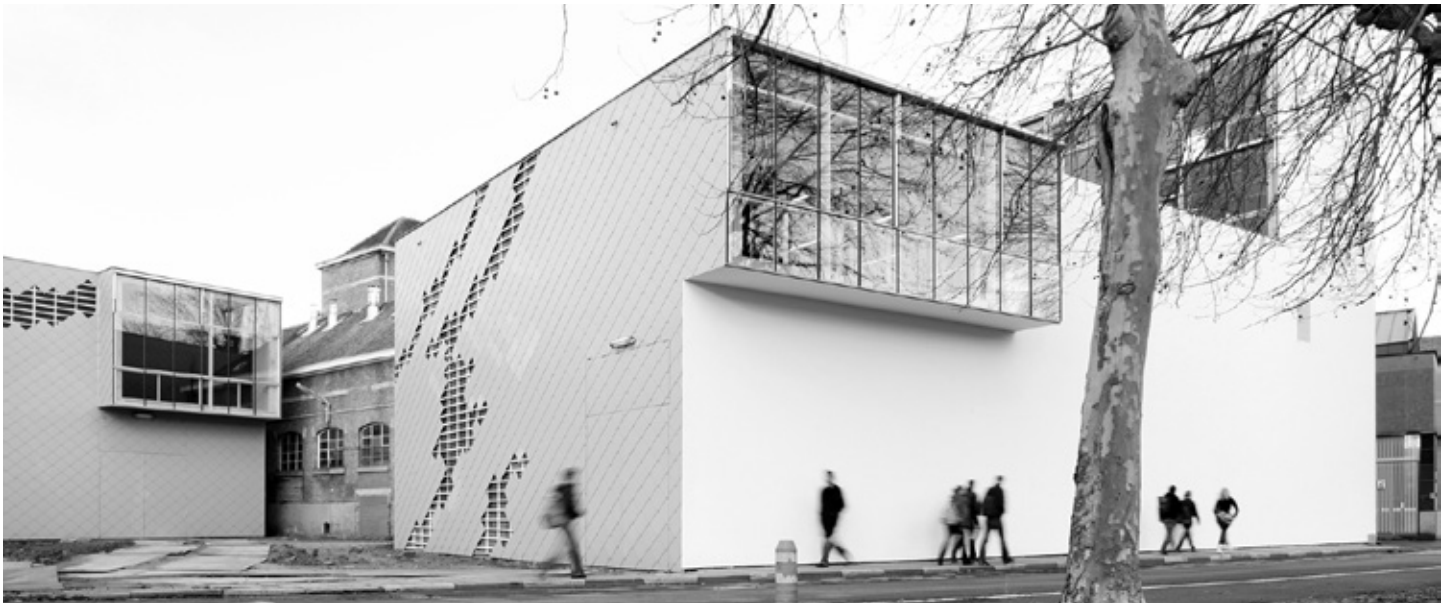
'Groengevel' in Gent. Hoe landschapsontwerp ook niet groen en stedelijk kan zijn. Foto: Bureau Bas Smets

van ingrepen in het bestaande landschap spelen hierbij een cruciale rol. Bovendien zijn landschappen ontmoetingsruimten: gebieden waar mensen samen tijdelijk of permanent verblijven en die een voortdurend en gemeenschappelijk object van zorg zijn. Het zijn sleutelementen voor individueel en sociaal welzijn en tegelijkertijd belangrijke bronnen voor economische ontwikkeling.